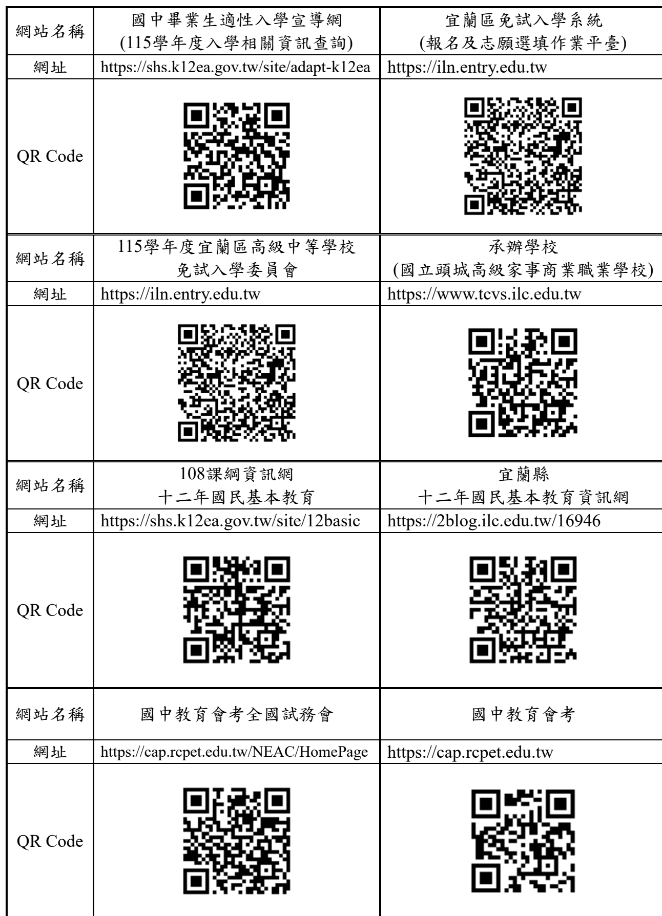
115學年度宜蘭區高級中等學校免試入學參考網站一覽表